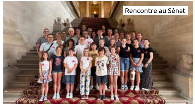
Rencontre au Sénat