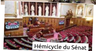
Hémicycle du Sénat