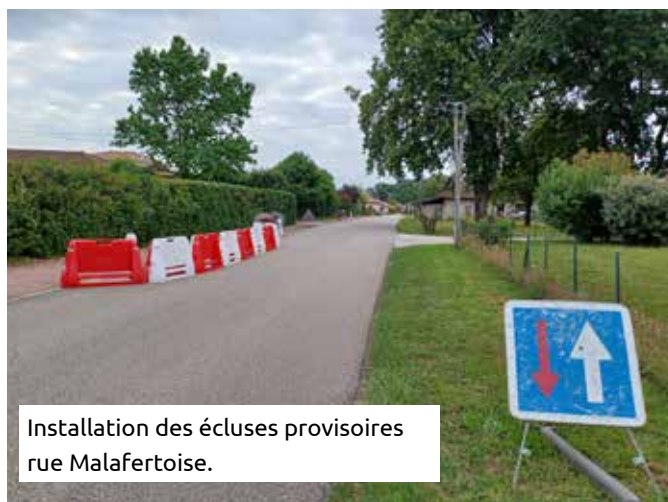
Installation des écluses provisoires rue Malafertoise.

Les travaux de déroulage et de raccordement des câbles se poursuivent. Le SIEA n'est pas encore en mesure de nous donner une date précise de mise en service mais l'objectif reste qu'elle soit effective d'ici à la fin d'année.