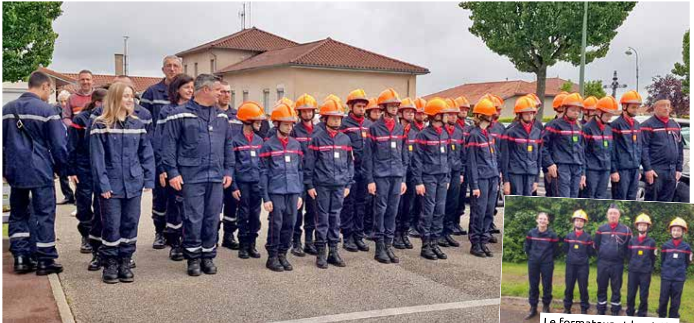
Le formateur et les 4 JSP