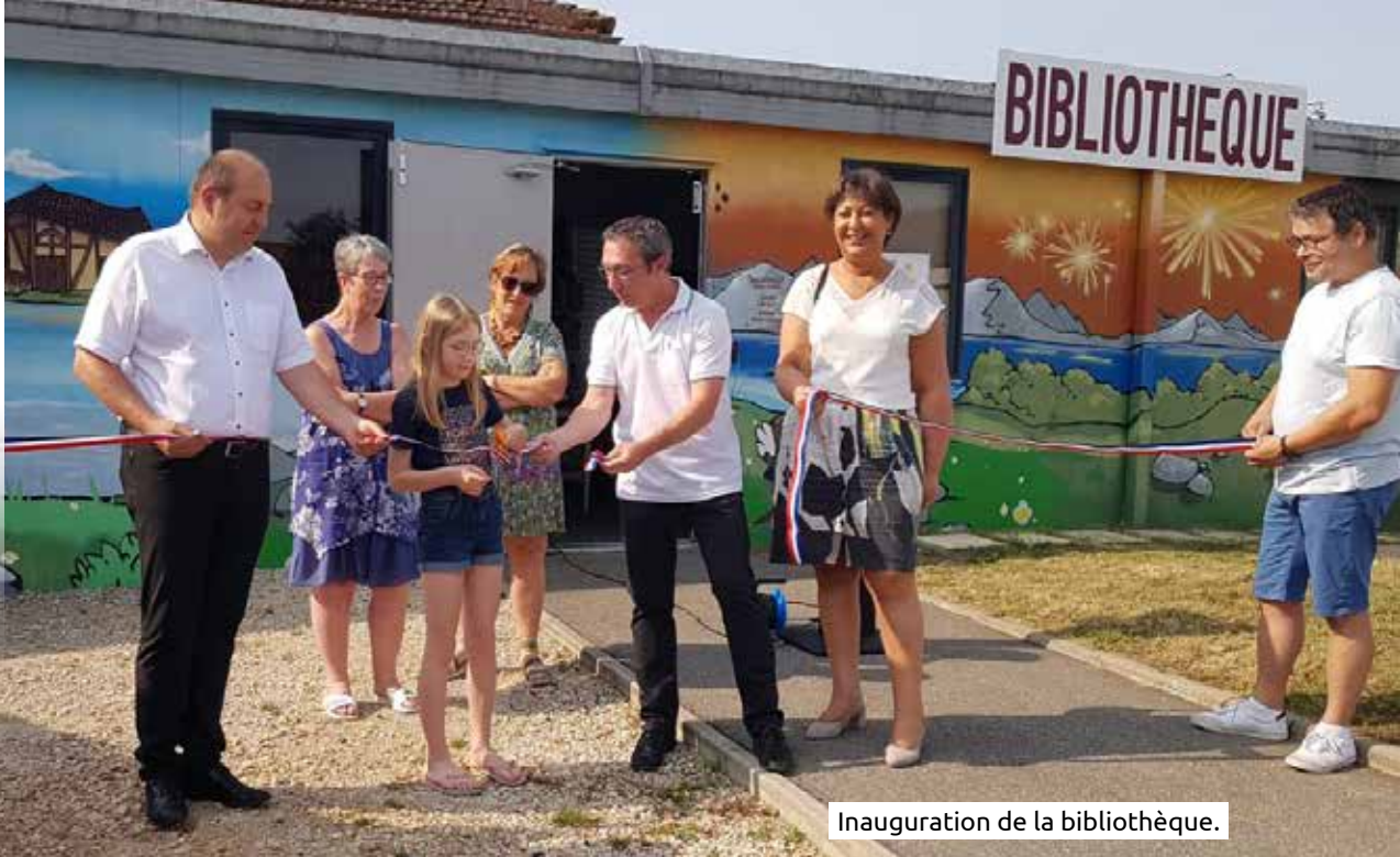
Inauguration de la bibliothèque.