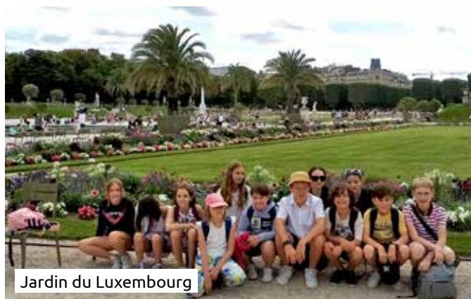
Jardin du Luxembourg

Après un passage devant le Palais de l'Élysée, direction Place de la Concorde puis traversée de la Seine pour arriver devant l'Assemblée Nationale, avant de rejoindre à pied les jardins du Luxembourg pour pique niquer.