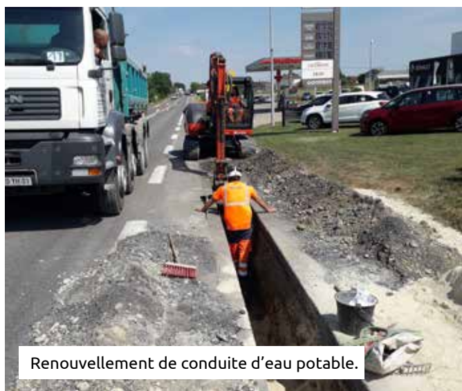
Renouvellement de conduite d'eau potable.