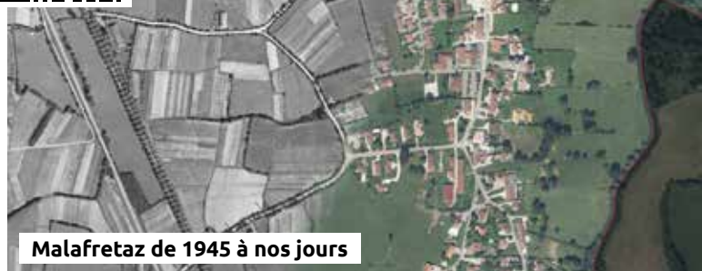
Malafretaz de 1945 à nos jours

dans notre village depuis 2020. Ces dernières ont été ou seront présentées également dans les différentes éditions de notre bulletin municipal. Vous pouvez le retrouver sur le site internet à la rubrique « Habiter Malafretaz/Bulletins municipaux ».