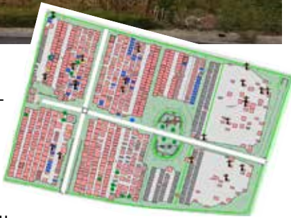
Exemple de numérisation

Des devis ont été demandés à plusieurs géomètres pour numériser notre cimetière selon le cahier des charges du syndicat intercommunal d'énergie et de e-communication de l'Ain (SIEA).