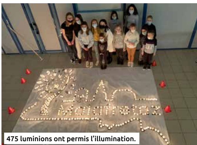
475 luminions ont permis l'illumination.

Enfin, le Téléthon s'est tenu le samedi 4 décembre. Pour cet événement, 2 défis étaient proposés : illuminer le logo de Malafretaz et réaliser une chorégraphie sportive. Cette action, proposée en association avec le comité des fêtes et le VAB a permis de collecter 360 € au profit des personnes atteintes de maladies génétiques. À travers cette belle action de solidarité, les enfants du conseil municipal ont eu la joie de recevoir un diplôme récompensant leur investissement.