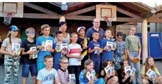
Remise des calculatrices et livres de fables de la Fontaine aux élèves de CM2.

L'organisation de la semaine scolaire connaîtra une petite modification des horaires. L'école commencera tous les jours y compris le mercredi à 8h30. Les matinées se termineront à 11h45 sauf pour le mercredi où la matinée se terminera à 11h30. Ce changement permettra de bénéficier de 15 minutes supplémentaires durant la pause méridienne. Les horaires de