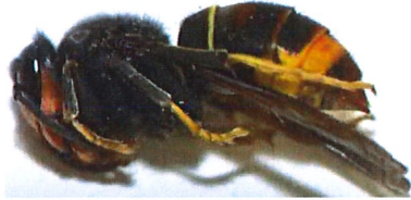
Gyne FA en dormance pendant la phase hivernale