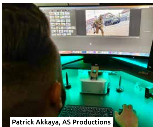
Patrick Akkaya, AS Productions

Avec une équipe de trois cadres, dont un télépilote de drone, nous avons capturé chaque instant clé grâce à sept caméras positionnées. Plus précisément, nous étions équi-