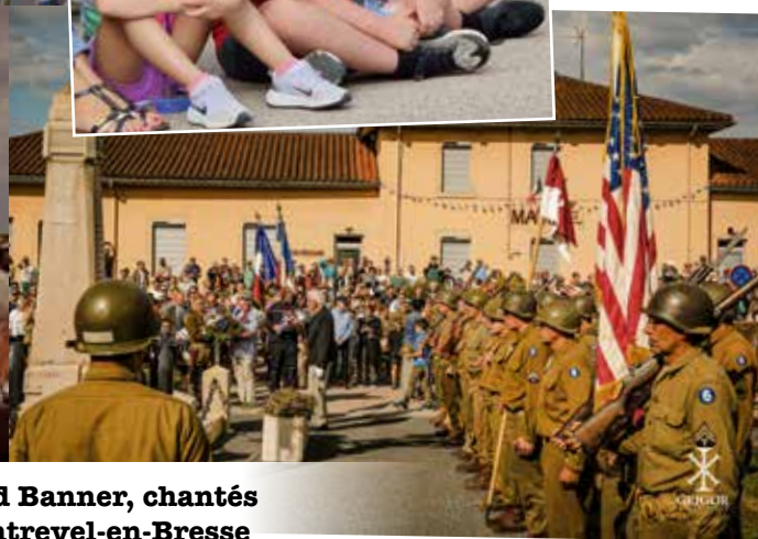
La Marseillaise et l'hymne américain, The Star-Spangled Banner, chantés par les enfants accompagnés de l'Union musicale de Montrevel-en-Bresse