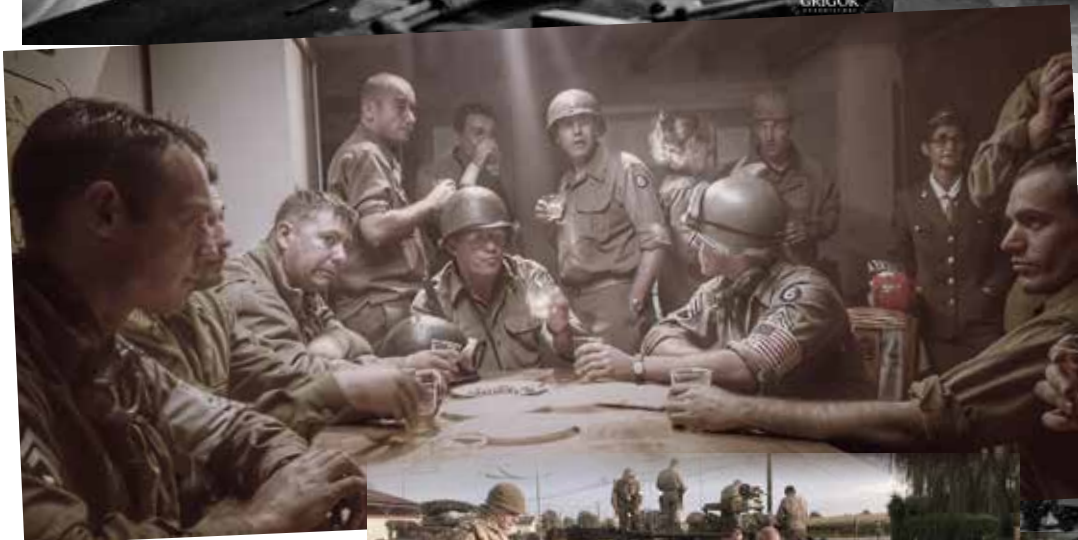
Le debrief de l'état-major américain avant le départ vers Malafretaz