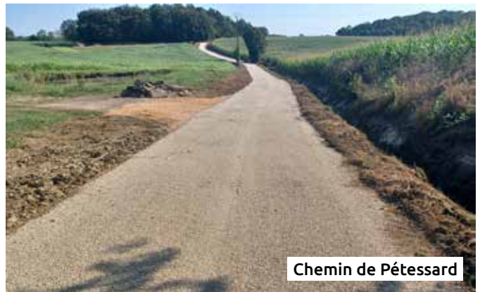
Chemin de Pétessard