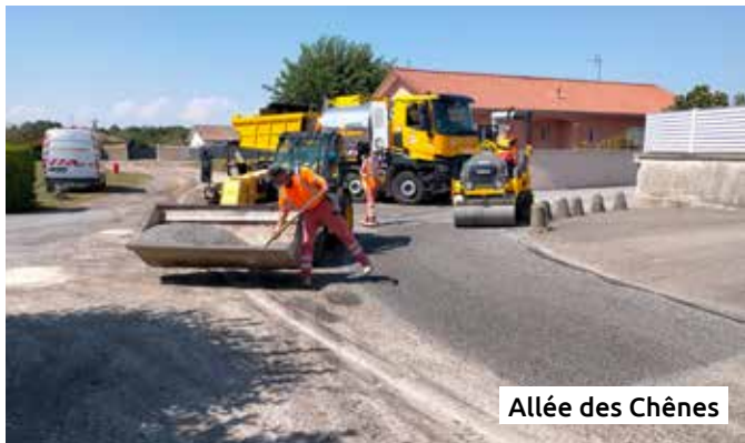
Allée des Chênes

Une information plus précise vous sera communiquée en temps opportun, dès que la date aura été fixée.